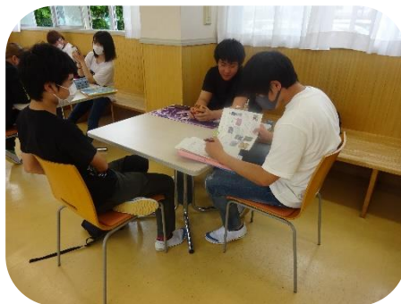
食堂でお互いに教え合いながら学習に取り組む生徒