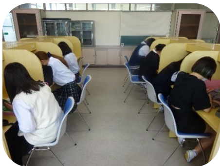
学習室で学習に取り組む生徒

私は今回高校初の考査に臨んで感じたことは、ただ一つ、緊張したということです。考査第1日目の前日、寝ようと思えばベッドに入ったものの考査のことが気になり全く寝付くことができませんでした。高校の考査というものがどのようなものなのか、考査開始までハラハラ・ドキドキでした。私は、始まってしまうと吹っ切れる性格なのですが、1日目が始まるまでの緊張感是非常に高いものがありました。今後も高校を卒業するまで考査はありますが、楽しみながら勉強を頑張っていきたいと思っています。高校生活を満喫していこうと思っています。