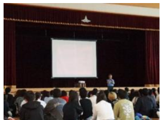
交通安全教室(6月25日)

※1 カナダのいじめ防止活動「ピンクシャツデー」の話を通して、いじめをなくすために自分たちができることを考え、ピンクの付箋に書いてまとめました。