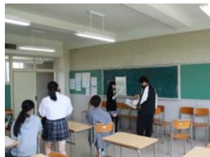
薬物乱用防止教室(6月27日)

7月4日(金)にスポーツフェスティバルが本校講堂と西体育館で開催されました。生徒有志による体育行事実行委員会がプログラムや実施種目の検討、事前準備を行い、ソフトバレーボール、ドッジボール、バドミントン、卓球、ストラックアウト、アームレスリングの6種目が行われました。暑い中でも事故やトラブルもなく熱戦が繰り広げられ、楽しい1日を過ごすことができました。